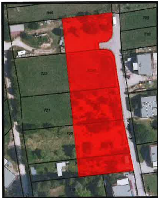
Auszug Lageplan (ohne Maßstab)